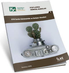
Sivil Toplum Kuruluşlarında Gönüllülük: Sorunlar ve Çözüm Yolları