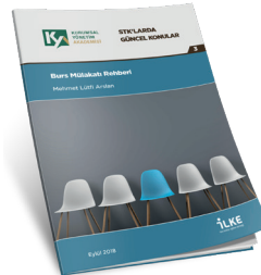
Burs Mülakatı Rehberi