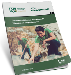
Üniversite Öğrenci Kulüplerinde Yönetim ve Organizasyon