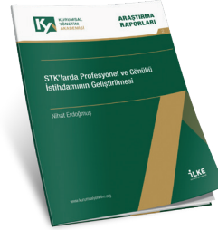
STK'larda Profesyonel ve Gönüllü İstihdamının Geliştirilmesi