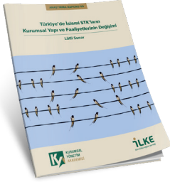
Türkiye'de İslami STK'ların Kurumsal Yapı ve Faaliyetlerinin Değişimi